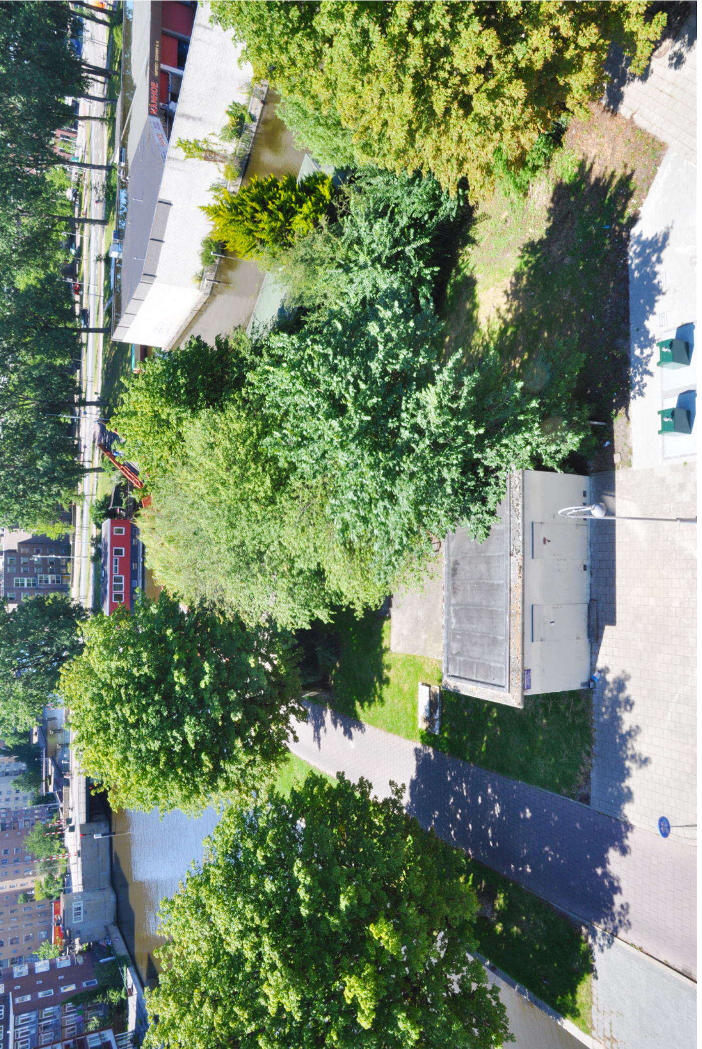
DE ZUIDPUNT BUYSKADE IN HAAR HUIDIGE STAAT